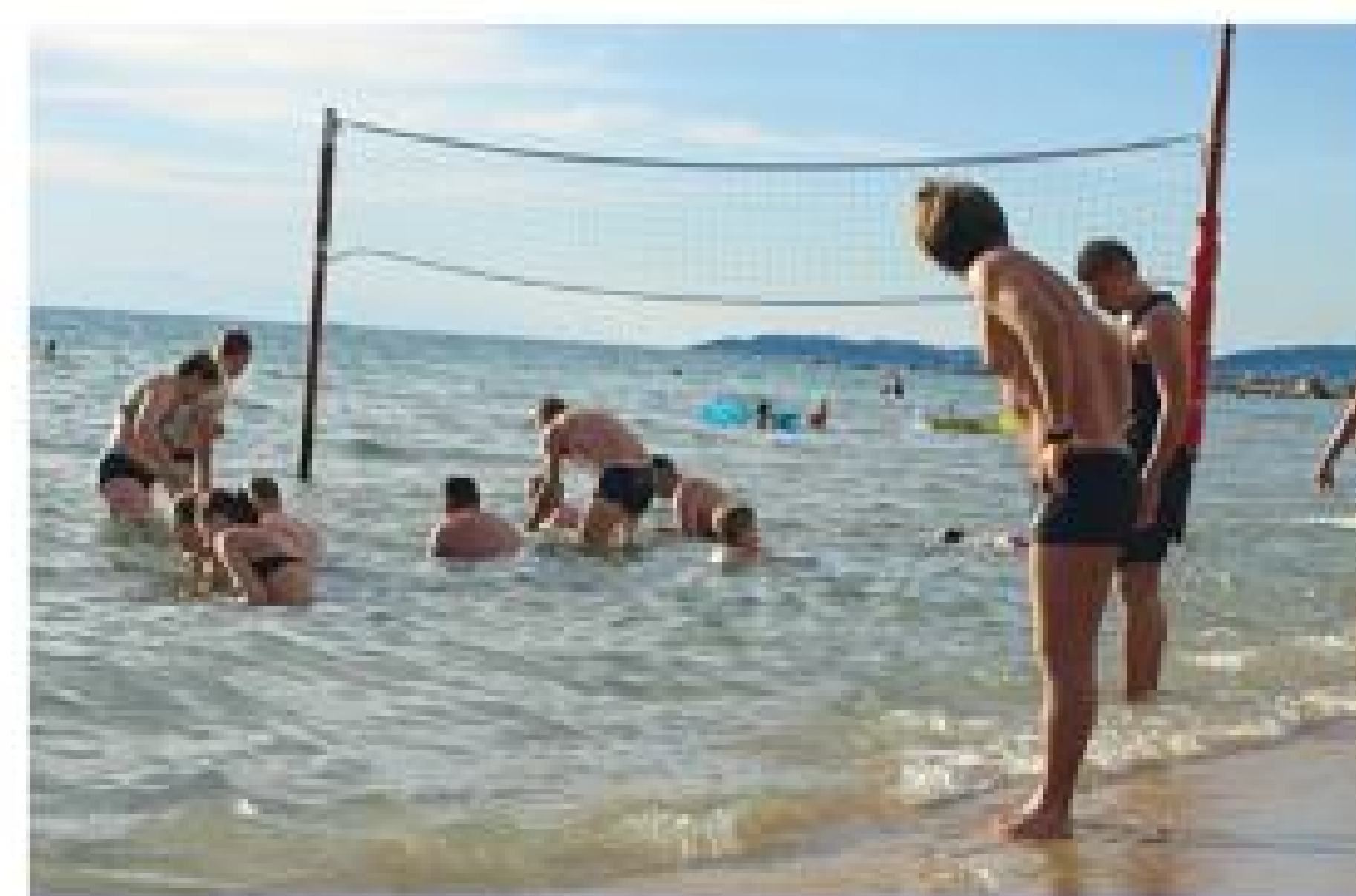
Номинация «Что для вас означает слово «Социум», 1 место у работы «Взаимопомощь»

Редакция связалась с победителями фотоконкурса для уточнения адресов доставки подарков.