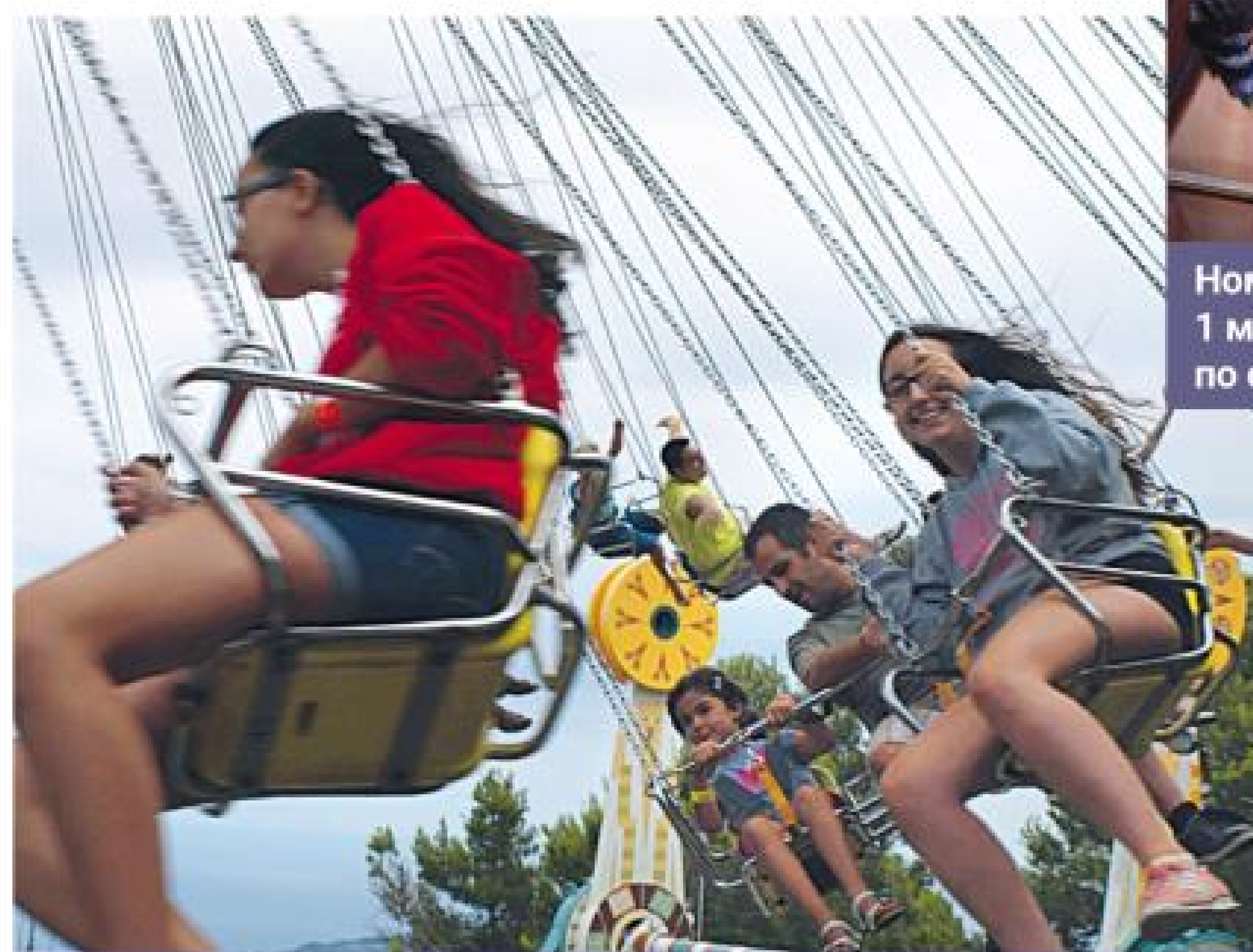
Номинация «Отдых. Отпуск. Дача», 1 место у работы «Карусель», автор фото: С. Ерёмин