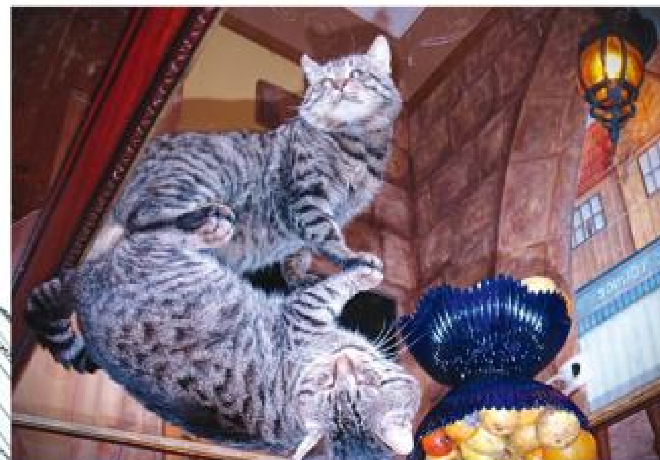
Номинация «Братья наши меньшие» 1 место у работы «Кошка, которая гуляет сама по себе», автор фото: Наталья Гордеева